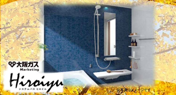
大阪ガス Marketing Hiraiyu システムバス セロイユ ※写真はイメージです

やっぱりおうちが大好きおうち時間をもっと大切に このたび「住みカタ・リフォームフェア」を裏面の日程で開催させていただくこととなりました。 この会場では、システムバスはじめシステムキッチン、洗面化粧台、トイレなど多数展示しております。 この機会に、お家時間をもっと快適にしませんか？ 家族みんなが笑顔で過ごせるよう、快適な暮らしをご提案いたします。