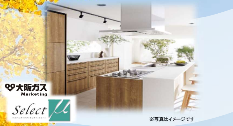
大阪ガス Marketing Select システムキッチン ※写真はイメージです